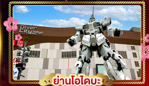
ย่านโอไดบะ