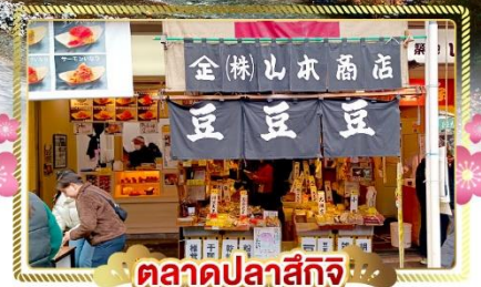
ตลาดปลาสึกิจิ