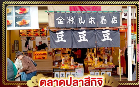
ตลาดปลาสด